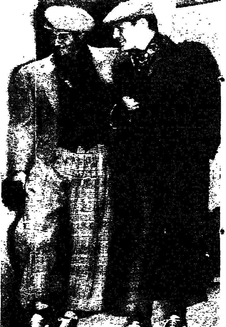
قام هذان الشبان أمس الأول بعرض تشكيلية من ملابس السبور عائدة إلى مجموعة المصمم الياباني كنزو يوسم ربيع وصيف ١٩٨٩. باريس - أ ف ب